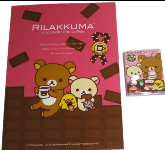
E. A4 筆記本+四折造型便利貼