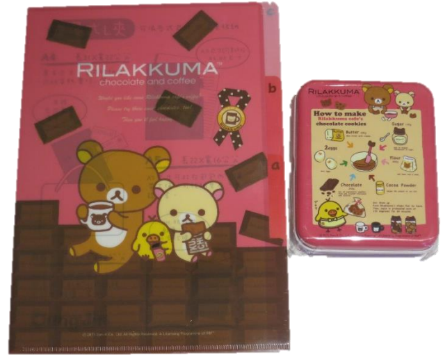
B. A5 三層 L 型夾+鐵盒便條紙