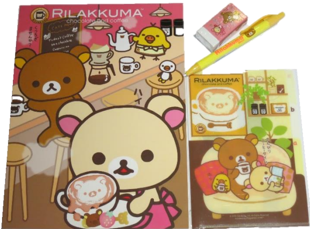
C. 筆記本+A6 三層 L 夾+自動鉛筆+橡擦