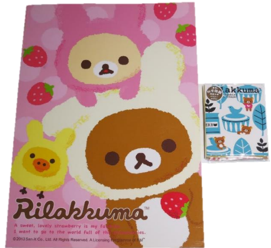
D. A4 筆記本+四折造型便利貼