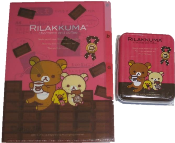
A. A5 三層 L 夾+鐵盒便條紙